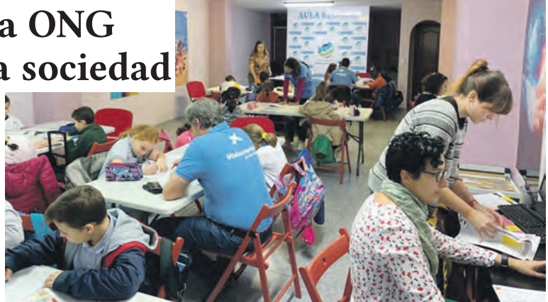
El aula de apoyo escolar es un referente para Recicla-Alicante.