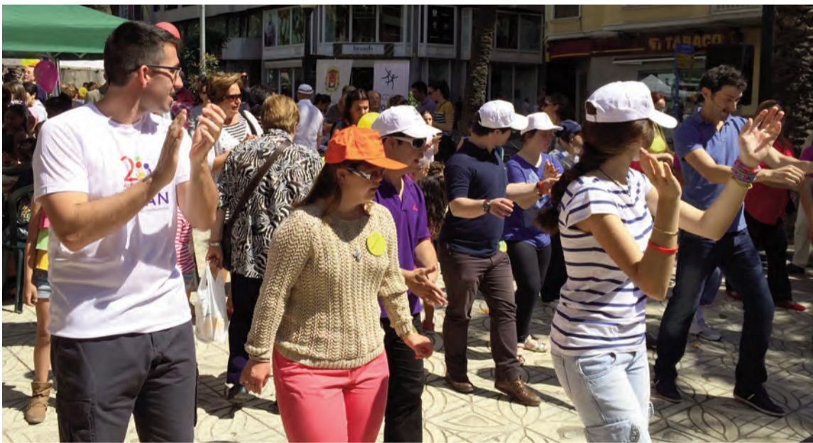
Momento del taller de baile ofrecido por Recicla-Alicante

Instituto Pedro Herrero, Carolina Martínez. Las distintas asociaciones participaron, además, con actividades y talleres. Recicla-Alicante lo hizo con un taller de baile. El día finalizó con una paella gigante. El Instituto Pedro Herrero se centra en el estudio y tratamiento de problemas familiares y en el diseño de programas específicos de apoyo y asesoramiento a colectivos profesionales, instituciones y asociaciones. Está compuesto por un equipo multidisciplinar de expertos en resolución de conflictos interpersonales aplicados tanto al campo familiar, empresarial como profesional, todos especializados en terapia familiar.