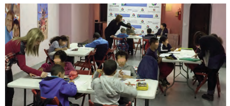
Los niños, muy entregados en sus deberes