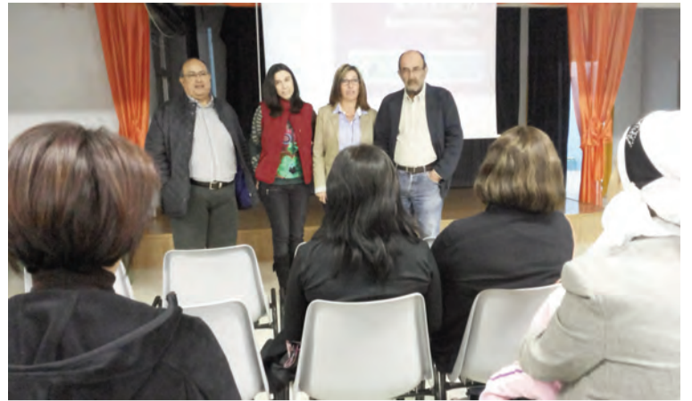
Momento de la presentación del Taller de Padres en Redován