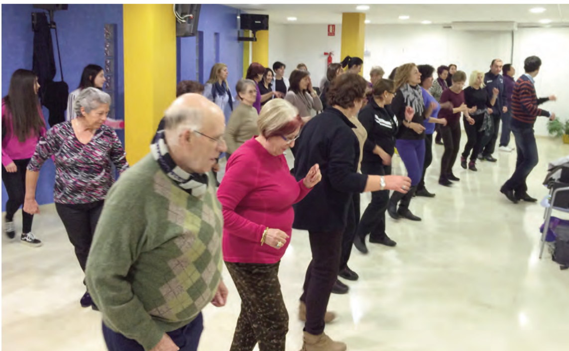
Una de las clases de baile en Rafal

Simplemente que lo prueben y decidan. Es una actividad que, además de aprender y hacer ejercicio, es muy divertida y se conoce a gente nueva.