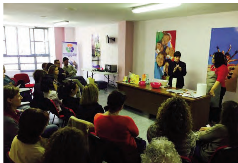
Un momento del taller de cocina que si hizo el año pasado