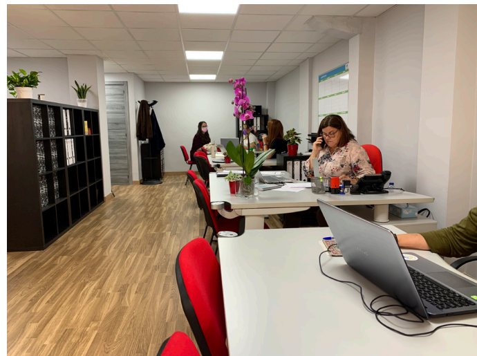
Foto oficina de Alicante

Lo cierto es que no ha sido un año fácil de desarrollar, en una situación inusualmente difícil en un país triste, asediado y desigual. Creemos humildemente que hemos podido desempeñar nuestra labor dignamente, en unas condiciones adversas marcadas por el confinamiento, que nos obligó a recurrir al teletrabajo con carácter de urgencia. Los servicios informáticos de la institución establecieron un sistema que nos permitió desempeñar nuestras funciones. Y lo que es más importante, pudimos mantener plenamente abiertas nuestras vías de comunicación con los ciudadanos para que pudiesen, de forma individual o colectiva, dirigirse a nosotros transmitiéndonos sus carencias.